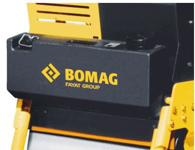
Geen aanhechten op asfalt Waterbesproeiing met grote watertank (standaard)