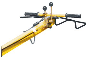
Precies en veilig bedienbaar Alle functies geïntegreerd aan de disselkop