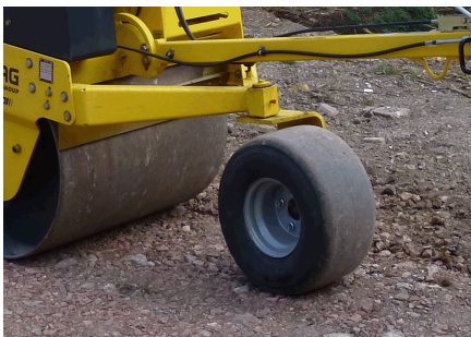
Comfortabel bestuurbaar Wielset (optioneel)